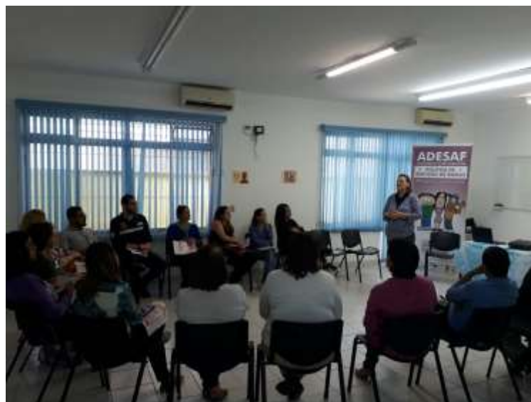
Realização de oficinas

O Seminário Políticas Públicas de Redução de Danos na Baixada Santista contou com o apoio e participação das prefeituras de Bertioga, Guarujá, Itanhaém, Mongaguá, Peruíbe, Praia Grande, Santos e São Vicente, tanto na realização de oficinas que aconteceram em cada município, quanto na realização do seminário.