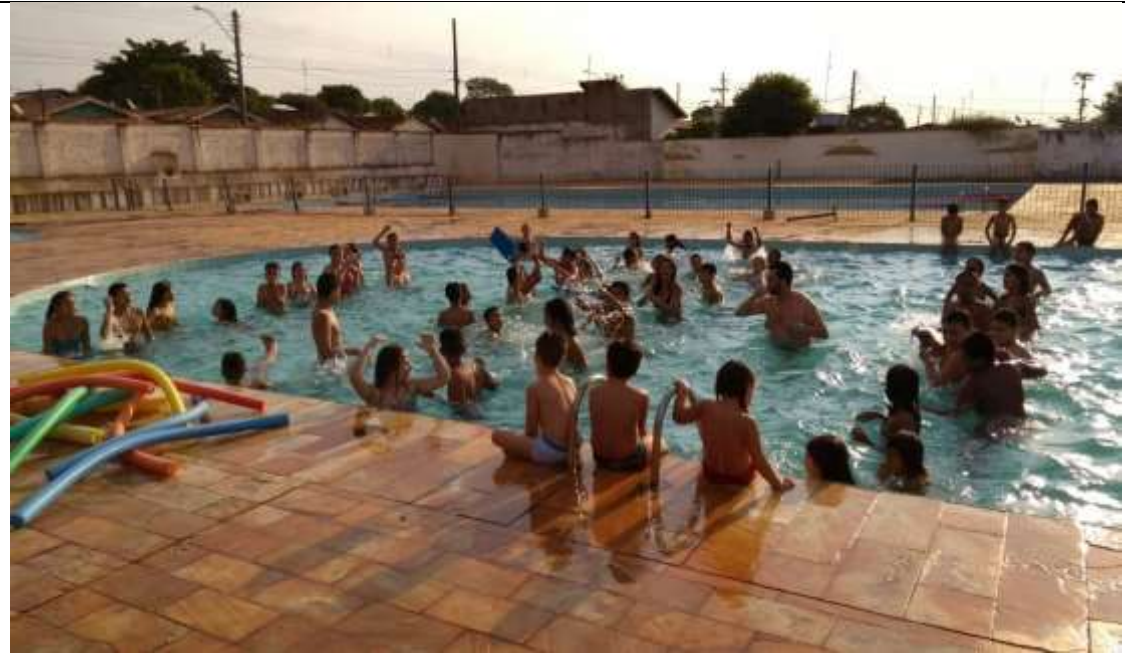
Natação – ADPM – Bairro São João e Parque São Paulo