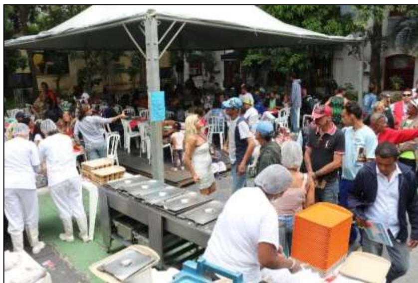
Realização do almoço no patio externo da Funarte

No término das apresentações, momento de desmobilização, os beneficiários foram encaminhados para a entrega do panetone e convidados para confraternizarem em um almoço coletivo. Houve aderência dos grupos e sentimento de gratidão pelo evento realizado.