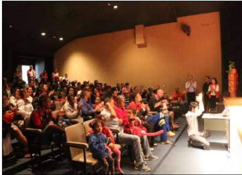
Sala Guiomar Novaes no dia da Formação Cidadã

A atividade apresentou como objetivos, o resgate de cidadania, criação/ fortalecimento de vínculo, discussão de avanços e perspectivas do programa em forma conjunta com apresentação dos resultados alcançados nos relatórios e ainda fomentar o espírito natalino de solidariedade, compaixão e partilha. Os beneficiários foram recepcionados pelos educadores com café da manhã e posteriormente direcionados para o auditório onde demos sequência nas atividades.