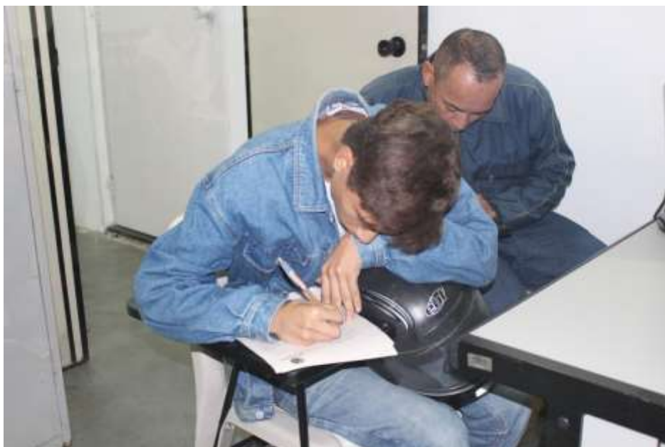
Assinatura dos contratos

O Cia Jovem é o projeto da Adesaf que abarca diversas ações estratégicas. Com o início deste projeto, em 2017, a Adesaf passou a integrar ações já desenvolvidas,