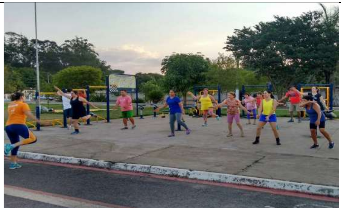
Ginástica 3ª idade – Centro Comunitário – Bairro São João e Parque São Paulo