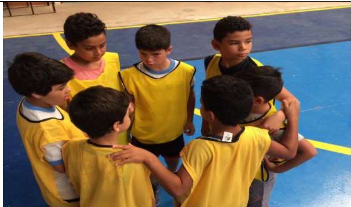
Futebol – Quadra Odenir Buzato – Nazaré