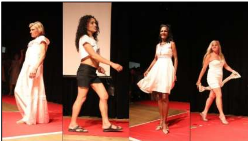
Beneficiárias do POT no desfile de moda realizado pela atividade Atelier de Costura

Na ocasião realizamos entrega de certificados de participação do POT que computa todas as horas de atividades práticas remuneradas. Ainda durante a formação aconteceram diversas manifestações artísticas como apresentações musicais, desfile de moda com peças produzidas ou customizadas pela atividade Atelier de costura. Para realização do desfile destacamos a atividade do Stúdio POT Hair, que fez a produção dos cabelos e maquiagens e os próprios beneficiários de diversas frentes participando como modelos.