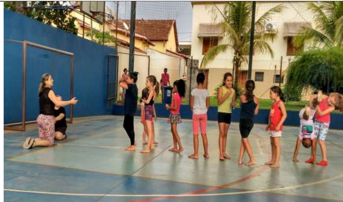
Ginástica Rítmica – Casarão - Centro