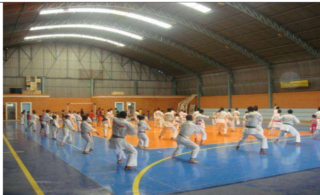
Karatê – Associação Fuji Banzai