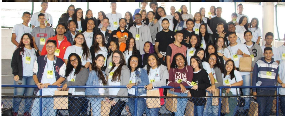
Participação do Cia Jovem e INICIA na Conferência Municipal da Juventude de São Vicente (set/19)