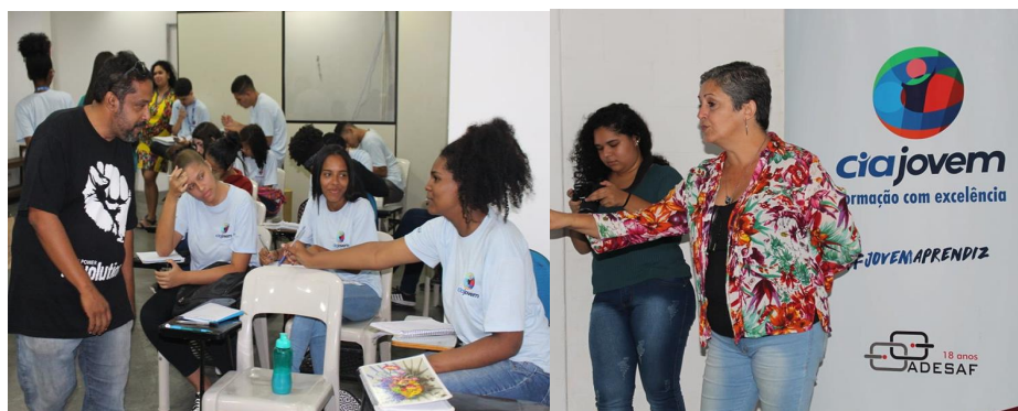
Palestras e atividades sobre o mês da Consciência Negra (nov/19)