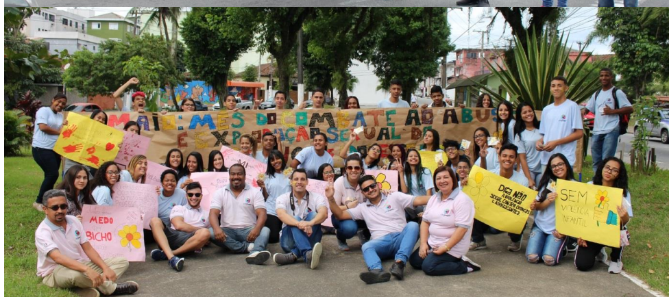
Ação ao mês do combate ao abuso e exploração sexual de crianças e adolescentes (mai/19)